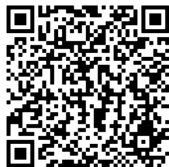
Фото блюд доступны по ссылке в QR-коде: Photos of dishes are available via the link in the QR code

Все цены указаны в рублях, включая НДС 20% All prices are quoted in roubles, including VAT 20%